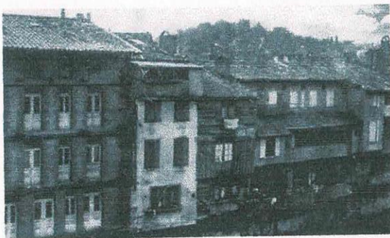
14, rue d'Empare, à Castres : la maison du milieu, comportant une seule fenêtre par étage ; le linge, au deuxième étage, est suspendu devant la chambre du logement qui fut celui de Mme Noémie Bouissière durant la seconde guerre mondiale.

On ne trouve pas le nom de Noémie Bouissière parmi les plus de 160 "personnes répertoriées comme ayant pris une part active dans la Résistance" à Castres. Et pourtant, des témoignages sur ses activités ne font pas défaut. Lors de l'évasion du 16 septembre 1943, elle a été, à l'extérieur, la cheville ouvrière de cette opération - même si maints détails nous échappent, parce qu'exécutés dans le secret de la conspiration. Ce ne fut pas sa seule activité de résistante : nous nous en sommes rendus compte en puisant dans diverses autres sources pour en savoir plus sur elle et mieux la connaître. Ce faisant, nous avons toujours eu conscience qu'il n'est pas possible, 60 ans après, de savoir tout ce qui c'est fait dans la clandestinité.